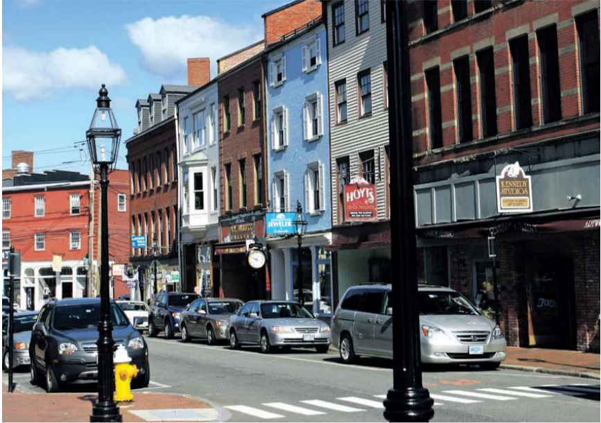
Portsmouth er fra 1630 og efter sigende den tredjeældste by i USA.