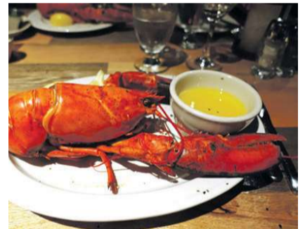
New England er berømt for sine fuldvoksne hummere, som ifølge amerikanerne er verdens mest smagfulde.