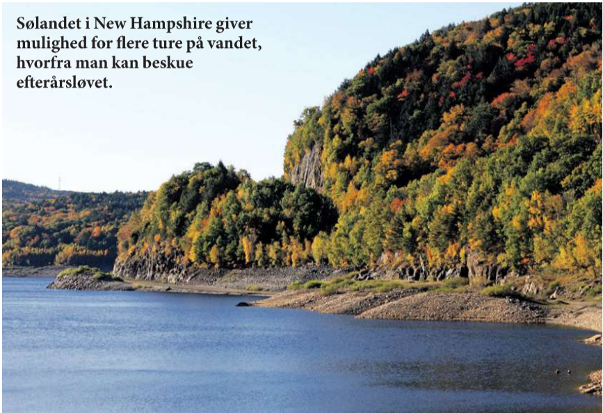
Sølandet i New Hampshire giver mulighed for flere ture på vandet, hvorfra man kan beskue efterårsløvet.