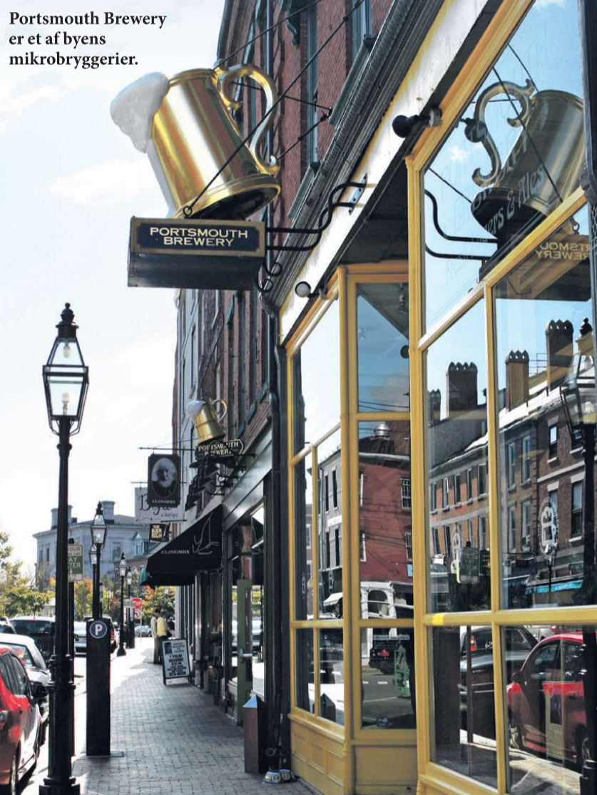
Portsmouth Brewery er et af byens mikrobryggerier.