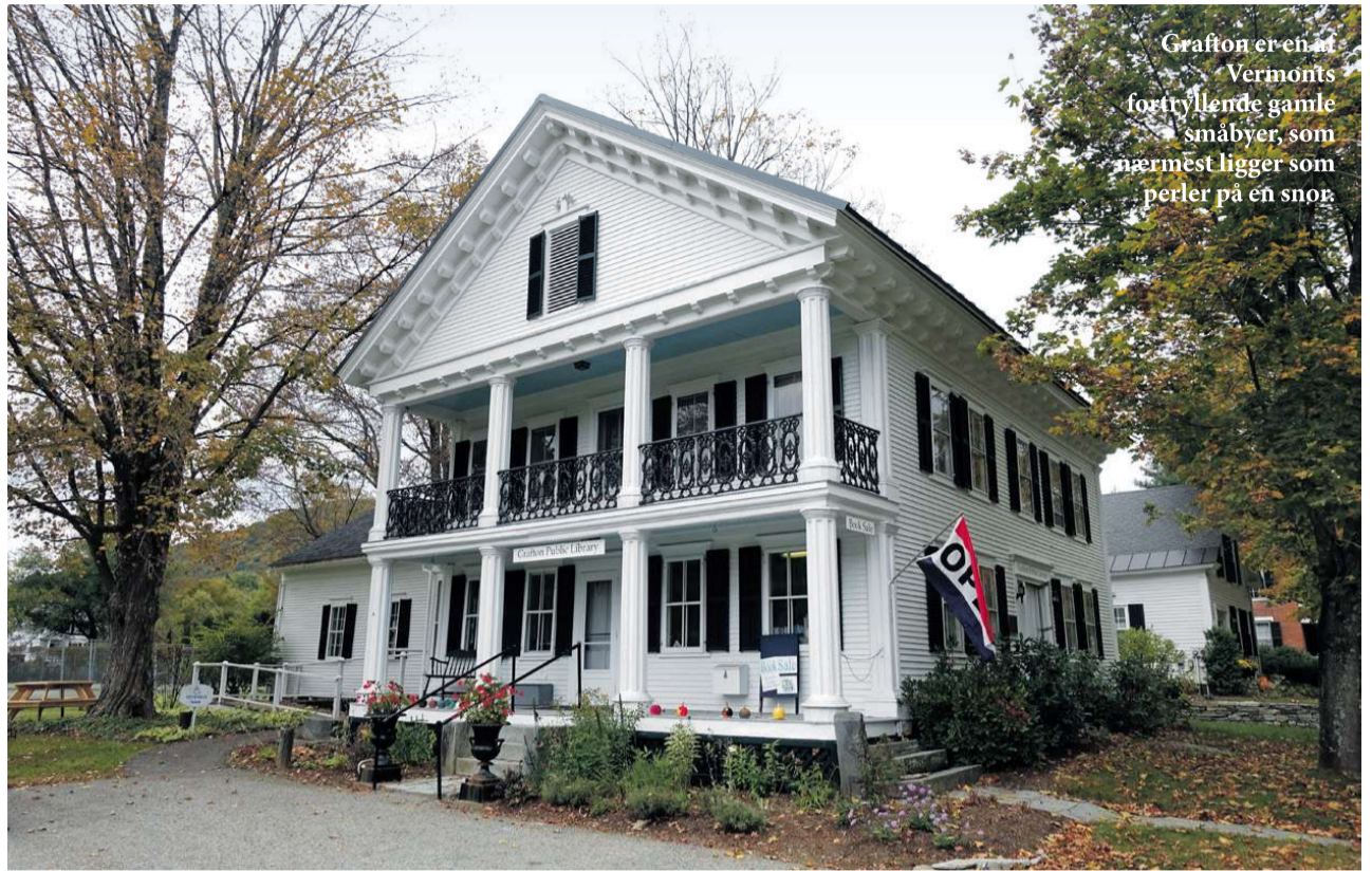
Grafton er en af Vermonts fortryllende gamle småbyer, som nærmest ligger som perler på en snor.

Vil du have afveksling fra bjergene, kan det være interessant også at nå ud til Atlanterhavet. Her er byen