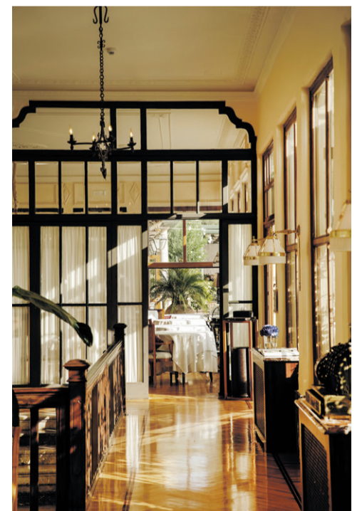
Gamle, lakerede parketgulve, høje sale, lyse vægge og mørkt træ dominerer Grand Hotel Timeos klassisk smukke indretning.

varekoncern LVMH Moët Hennessy Louis Vuitton SE – en del af Louis Vuitton-brandet. Ser omgivelserne bekendte ud? Anden sæson af HBO-successerien "The White Lotus" er optaget i Taormina.