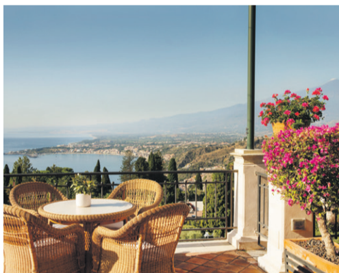
Selvom vulkanen Etna ligger 50 km fra Grand Hotel Timeo rejser vulkanen sig tydeligt i horisonten fra udsigten fra hotellets store terrasser.

et sted kunne ikke findes i virkeligheden! Geleng havde bare ladet fantasien få frit løb, sagde de.