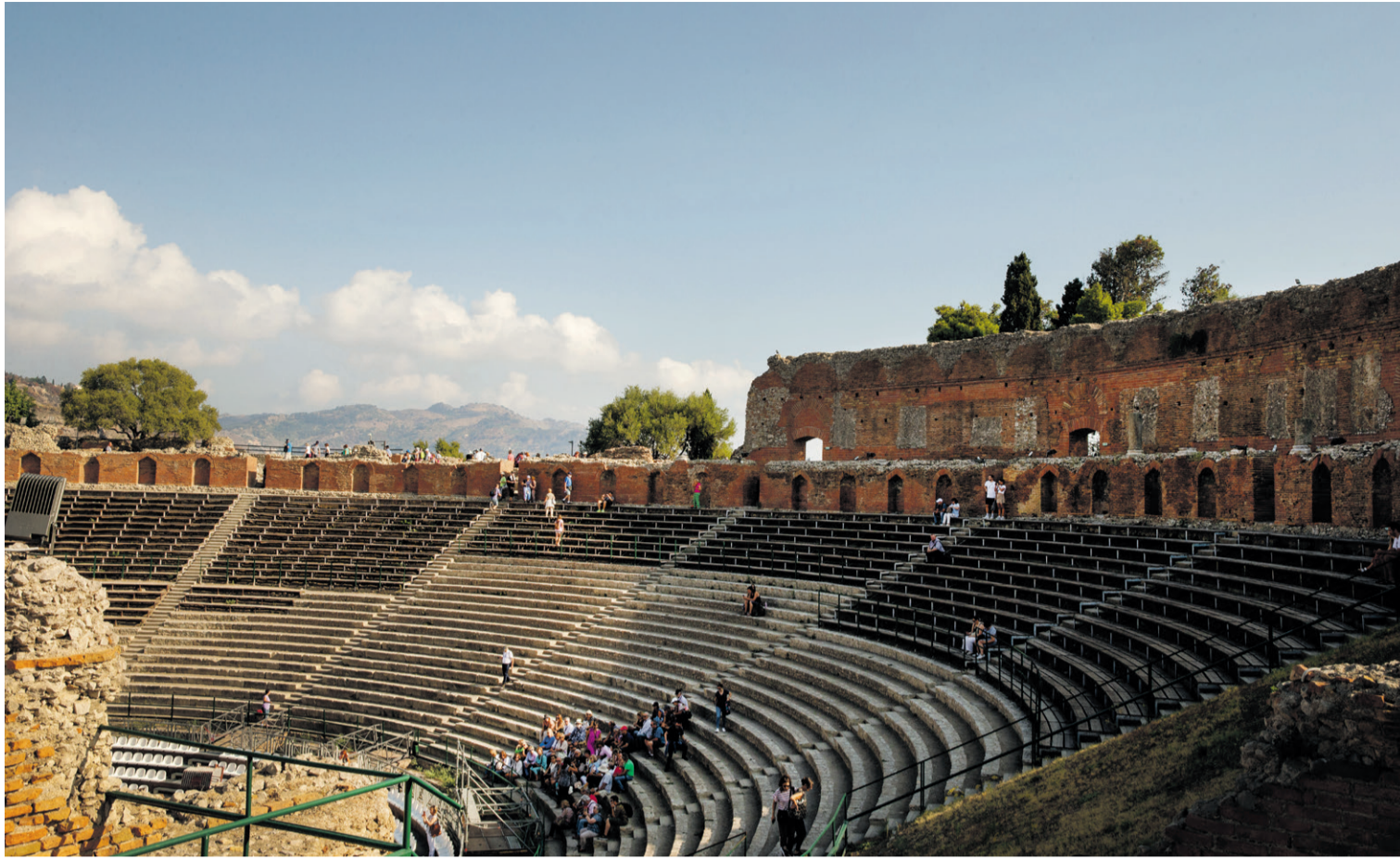
Det græske amfiteater i Taormina er Grand Hotel Timeos nærmeste nabo. Det har tiltrukket publikum siden år 300 før Kristi fødsel.