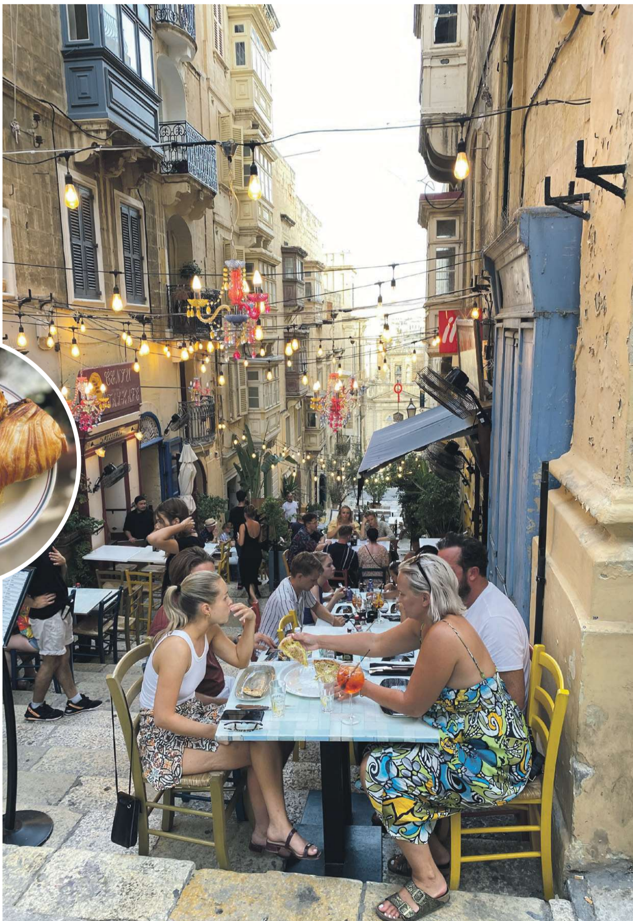
De smalle trappegader er forvandlet til livsnyder-zoner for barer og restauranter overalt i Valletta.