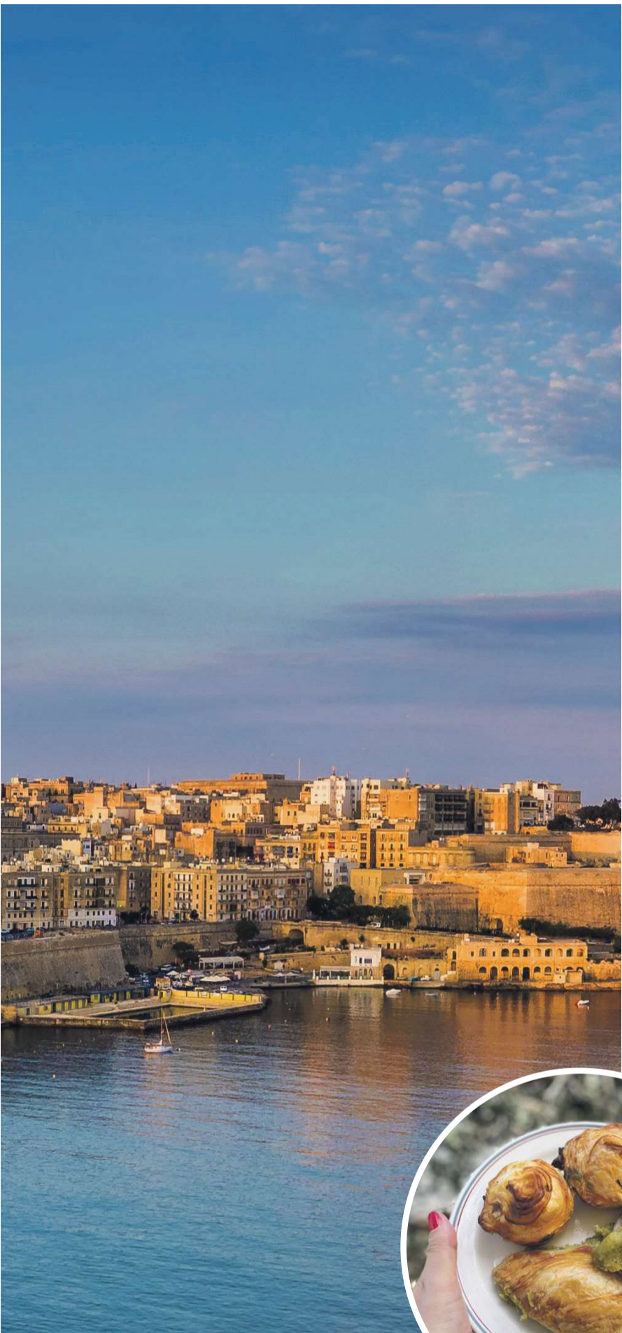
Valletta har formået at bevare sine mange smukke bygninger trods krige og besættelser.

pertoiret, fordi vi ikke ønskede at lave charterferier til diktaturstater eller udnytte fattigdom, men ø-riget var demokratisk, hvilket var meget væsentligt for vores beslutning.»