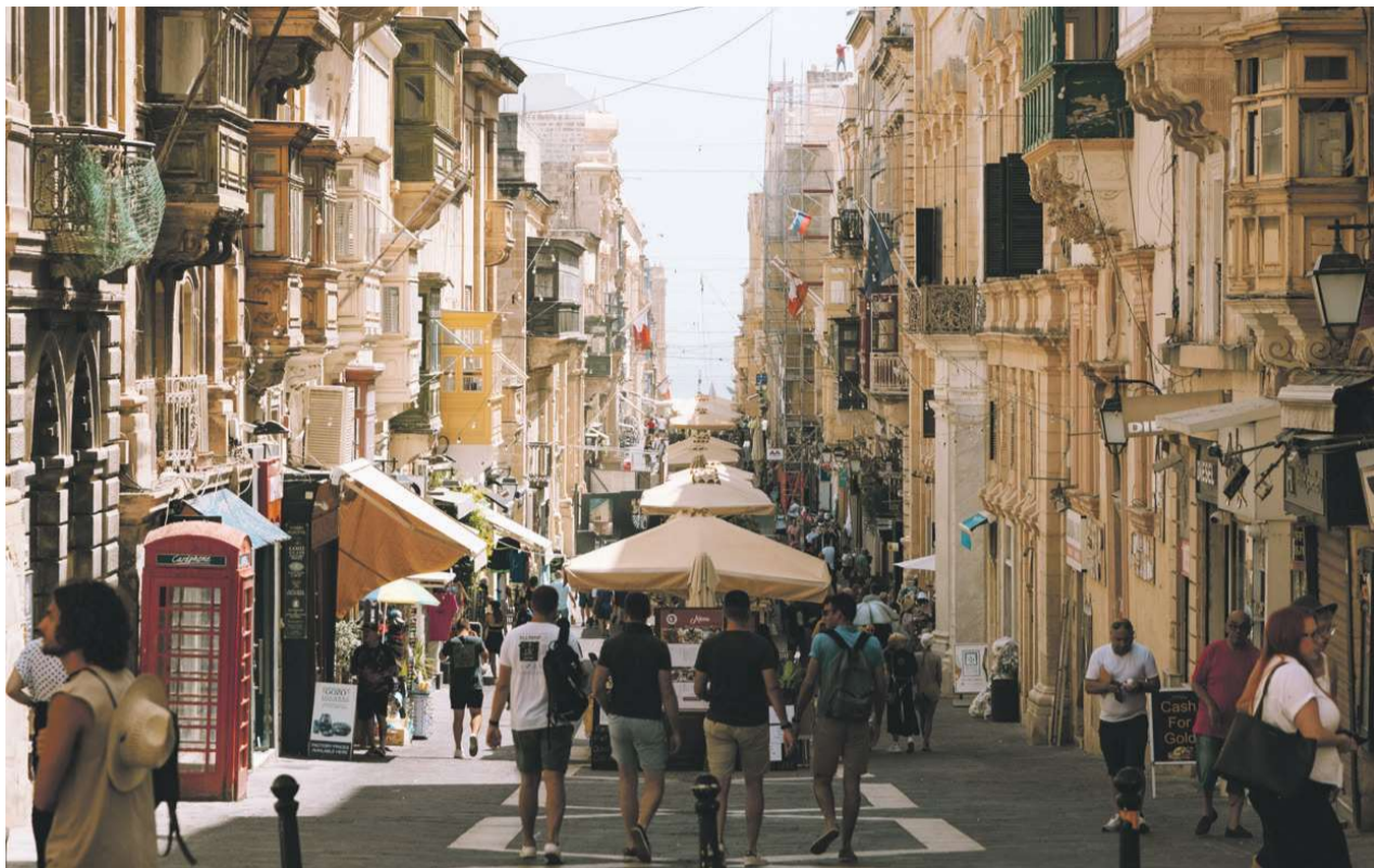
Merchant- og Republic-gaderne oser af shoppe-stemning.