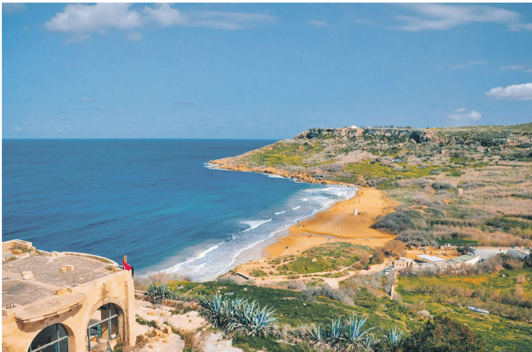
Ramla-stranden er Gozos største og populæreste.

AF ELSEBETH MOURITZEN, REJSER@WUNDERKIND.DK