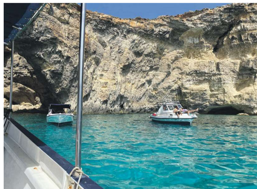
Den blå og krystal-lagunen er populære udflugtssteder ved Comino.

Lidt mere hold i det historiske er der ved Ggantija templerne i Ix-