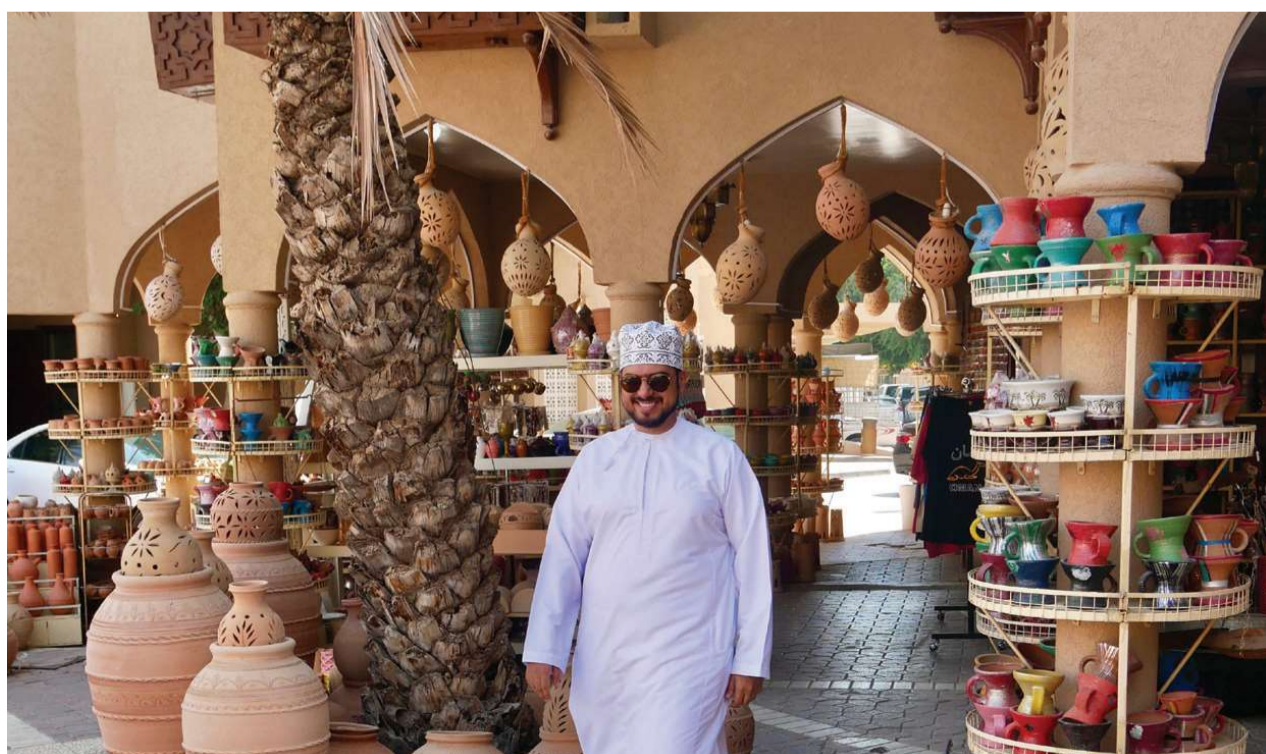
I souken i Nizwa kan man købe alt mellem himmel og jord – blandt andet kunsthåndværk og krydderier.