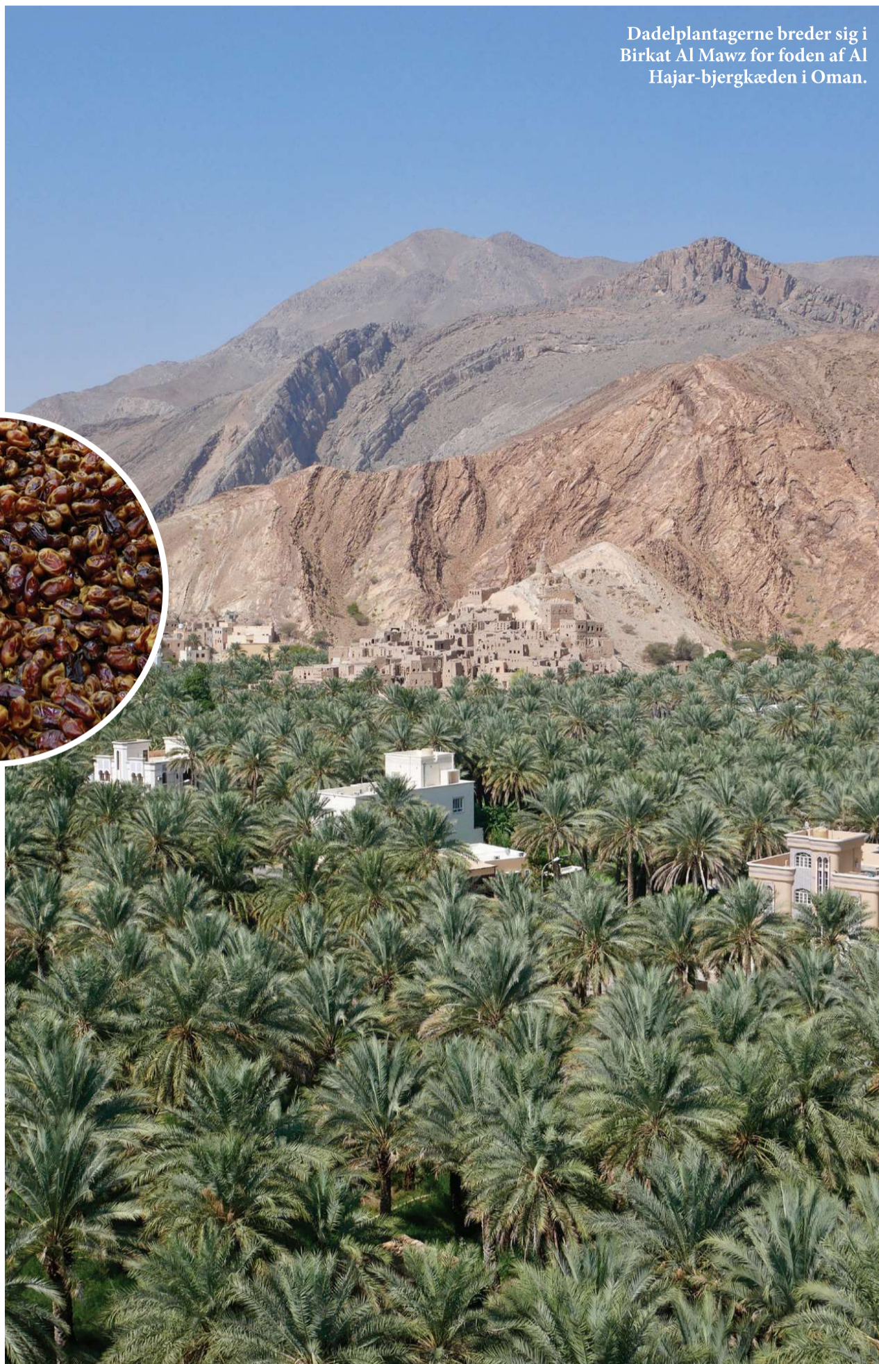
Dadelplantagerne breder sig i Birkat Al Mawz for foden af Al Hajar-bjergkæden i Oman.

Nizwa har i århundreder været en vigtig handelsby i Oman, og var engang landets hovedstad. I dag er byen også populær blandt turister, som kommer for at opleve den berømte souk – et overdækket markedsområde, som er opdelt i forskellige sektioner. Vi besøger blandt andet krydderimarkedet med eksotiske krydderier i alle farvenuancer, det udendørs marked med lertøj og an-