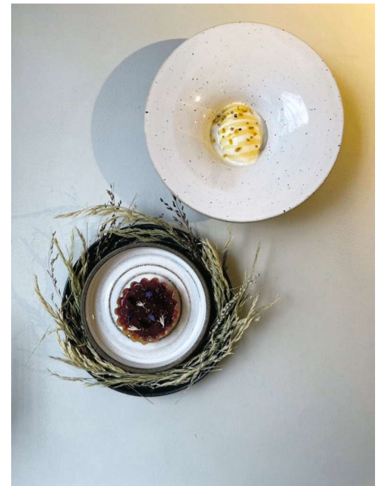
På Vilda restaurant er råvarerne enten lokale eller fra ejerens egen have.

Selv ude i Göteborgs Skærgård kan du finde hyggelige caféer med fokus på det lokale. På øen Hönö skal du huske at kigge forbi Lilling Cottage , som er en helhedsoplevelse, da det både er en café, blomsterbutik og indretningsforretning. Her lægger det søde personale vægt på at inddrage både din syns- lugte og smagsans i hver farverig bid, som smager af mere tilsat udsigten over havet og klipperne.