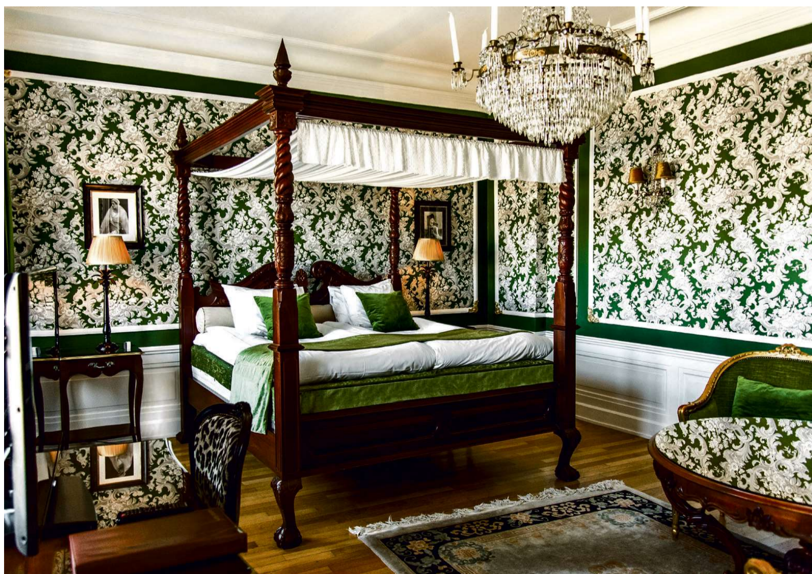
Hotel Eggers

For eksempel bidrager hotellet til Göteborgs Stadsmissions, der arbejder med akutte og langsigtede indsatser for at forbedre levestandarden for udsatte familier. Og hver jul bidrager de til projektet, Julklappsvagnen, som går ud på at samle og uddele julegaver til udsatte børn, unge og familier fra byens sporvogne. Og netop sporvognene er en del af oplevelsen ved at bo på Hotel Eggers. For de stopper få meter fra