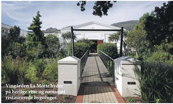
Vingården La Motte byder på herlige vine og nænsomt restaurerede bygninger.