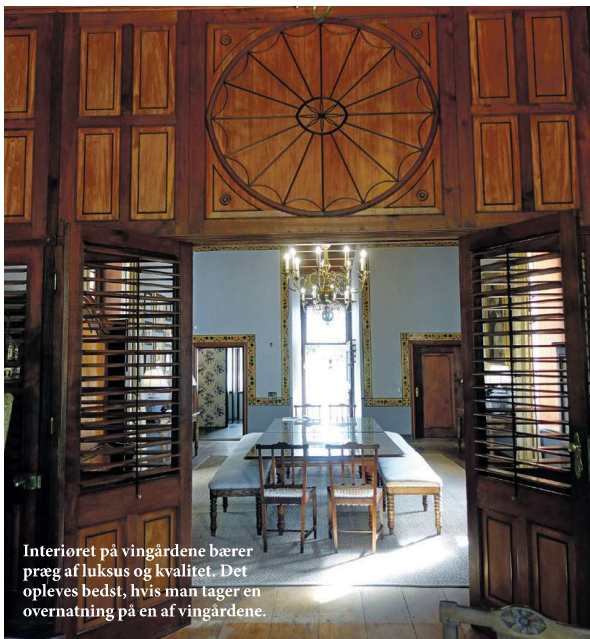
Interiøret på vingårdene bærer præg af luksus og kvalitet. Det opleves bedst, hvis man tager en overnatning på en af vingårdene.

re end 550 større og mindre vingårde. Flere er opført i den cape-hollandske byggestil med elegante rundbuer på gavle og facader. Ofte serverer vingårdene god mad i restauranterne – og flere steder er der også mulighed for overnatning.