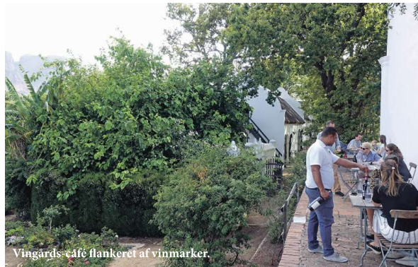
Vingårds-café flankeret af vinmarker.