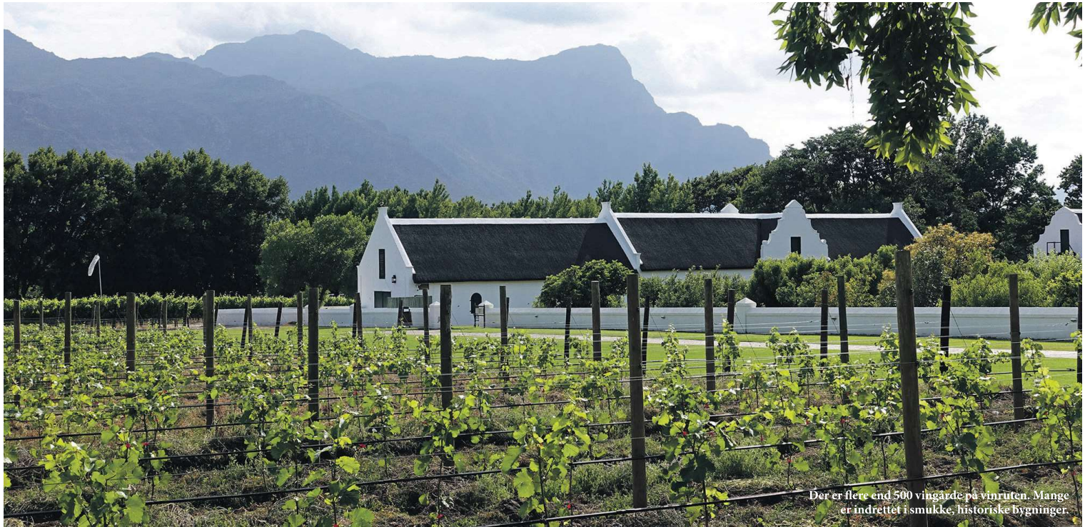
Der er flere end 500 vingårde på vinruten. Mange er indrettet i smukke, historiske bygninger.