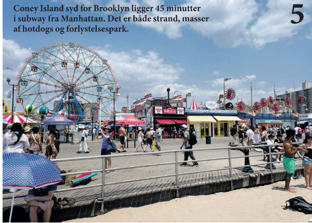
Coney Island syd for Brooklyn ligger 45 minutter i subway fra Manhattan. Det er både strand, masser af hotdogs og forlystelsespark.