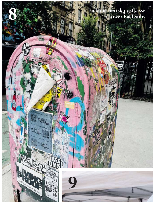
En kunstnerisk postkasse i Lower East Side.