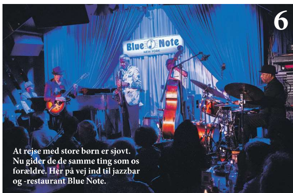
At rejse med store børn er sjovt. Nu gider de de samme ting som os forældre. Her på vej ind til jazzbar og -restaurant Blue Note .