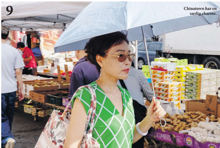
Chinatown har en særlig charme.

bygninger. Især foregår vandringer i et kvarter, som først var beboet af tyske indvandrere og blev kaldt "Kleindeutschland". Siden blev det overtaget af primært jødiske indvandrere, indtil det hele blev mere blandet og blev betragtet som "slum" af byens finere borgere. Som det ofte sker, er kvarteret i dag mere gentrificeret og er blevet hipt og ungdommeligt.