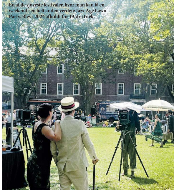
En af de sjoveste festivaler, hvor man kan få en weekend i en helt anden verden: Jazz Age Lawn Party. Blev i 2024 afholdt for 19. år i træk.