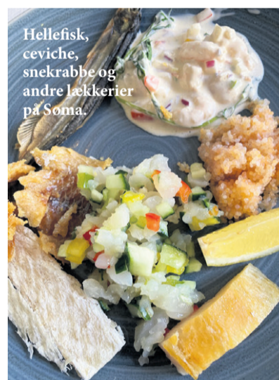
Hellefisk, ceviche, snekrabbe og andre lækkerier på Soma.