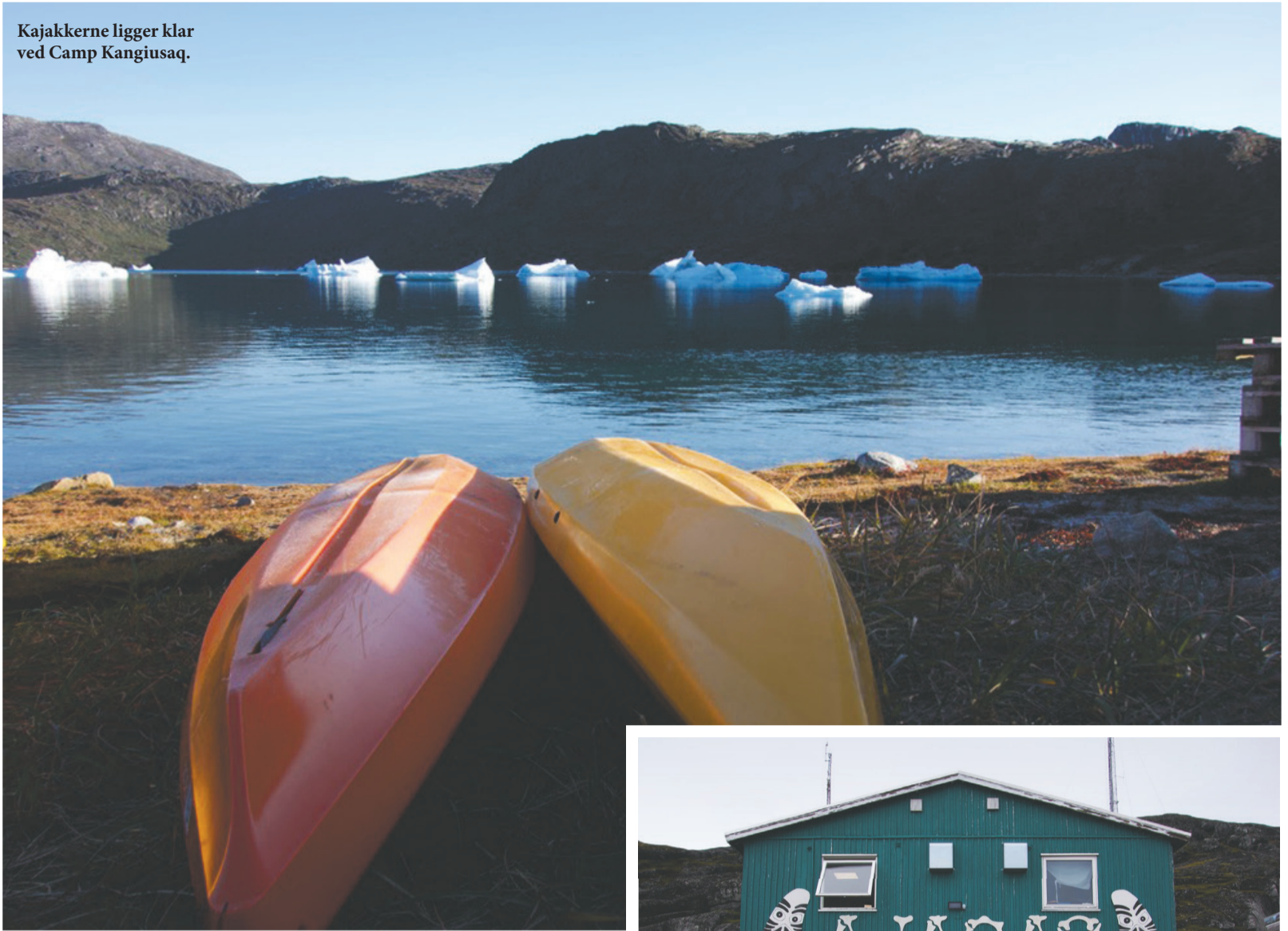
Kajakkerne ligger klar ved Camp Kangiusaq.