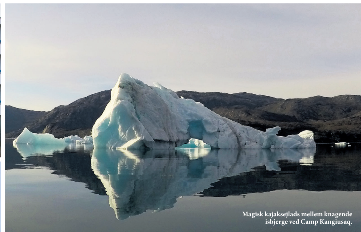
Magisk kajaksejls mellem knagende isbjerger ved Camp Kangiusaq.