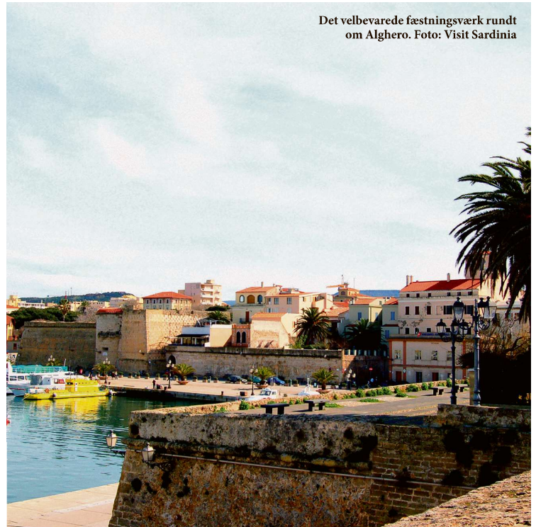
Det velbevarede fæstningsværk rundt om Alghero.

Men der er så meget mere at se på Sardinien. Øen er på størrelse med Jylland, så du når ikke det hele på en enkelt ferie, men det er en god undskyldning for at komme tilbage. For Sardinien er stærkt vanedannende.