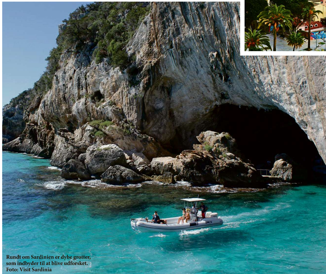
Rundt om Sardinien er dybe grotter, som indbyder til at blive udforsket.