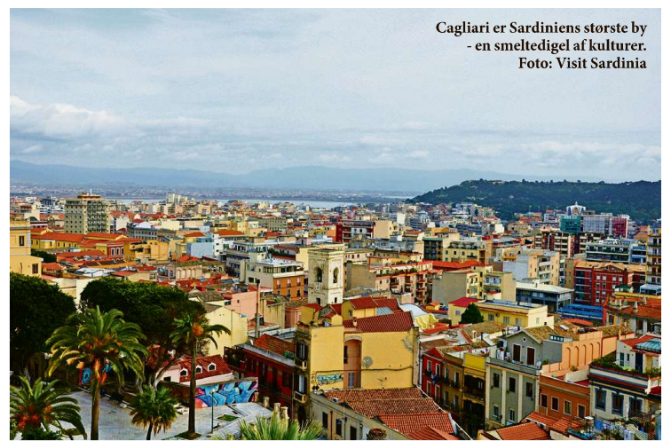
Cagliari er Sardinien's største by - en smeltedigel af kulturer.