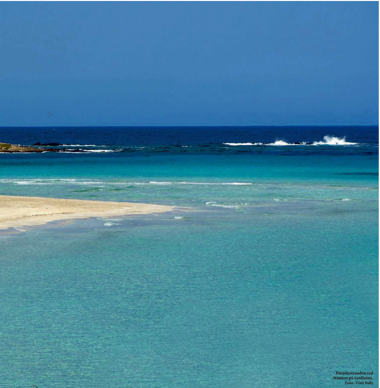
Paradisstranden ved Stintino på Sardinien.

ud på ferien, er Sardinien perfekt. Det er stedet at lave ingenting. Som i absolut ingenting. Det er bare at smide sig på en smuk strand, slappe af og lade tiden stå stille.