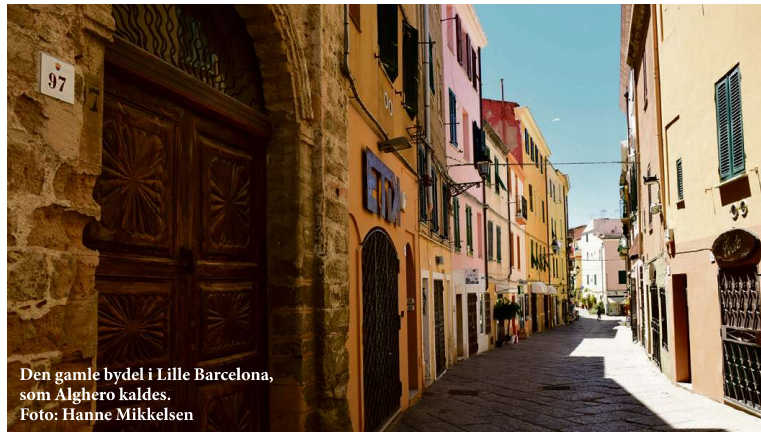
Den gamle bydel i Lille Barcelona, som Alghero kaldes.