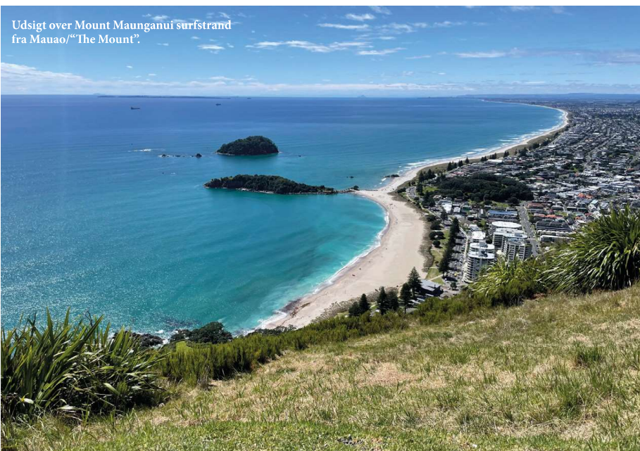
Udsigt over Mount Maunganui surfstrand fra Mauao/"The Mount".