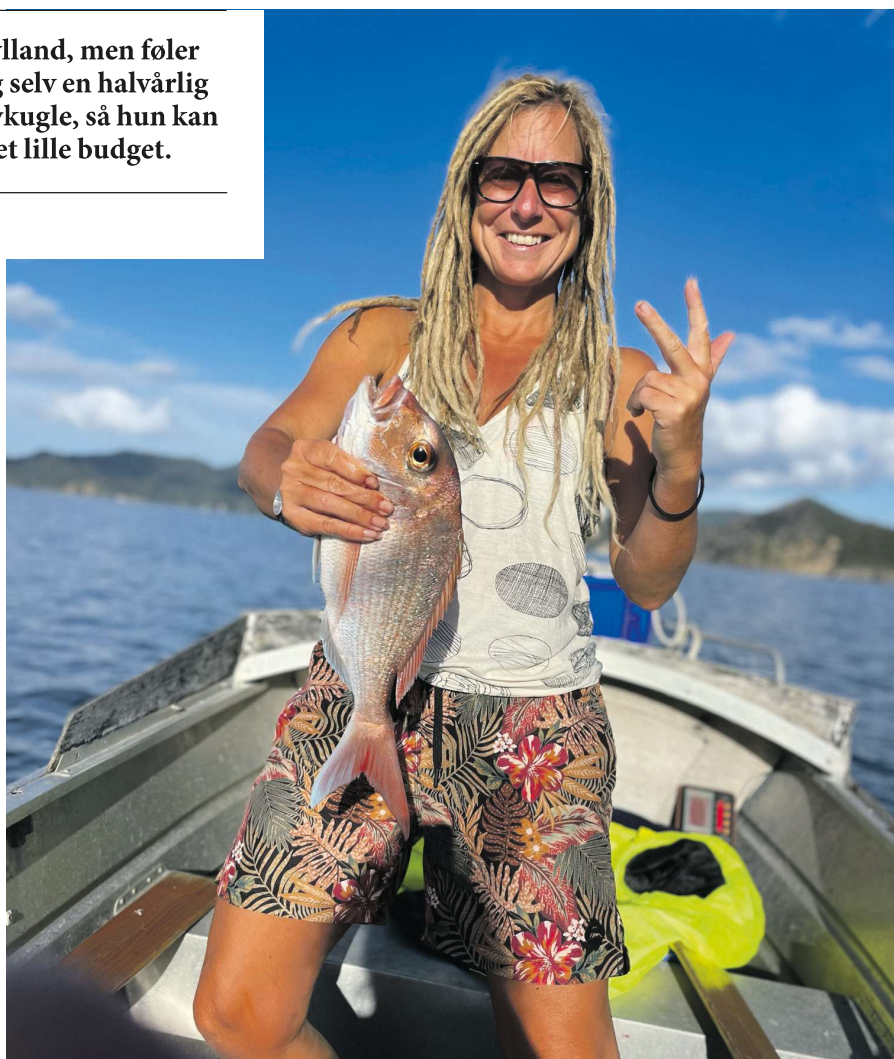
“Tre Red Snapper på 8 minutter”.

Jeg ser mod den lille klippehalvø længere oppe ad stranden og kan ikke