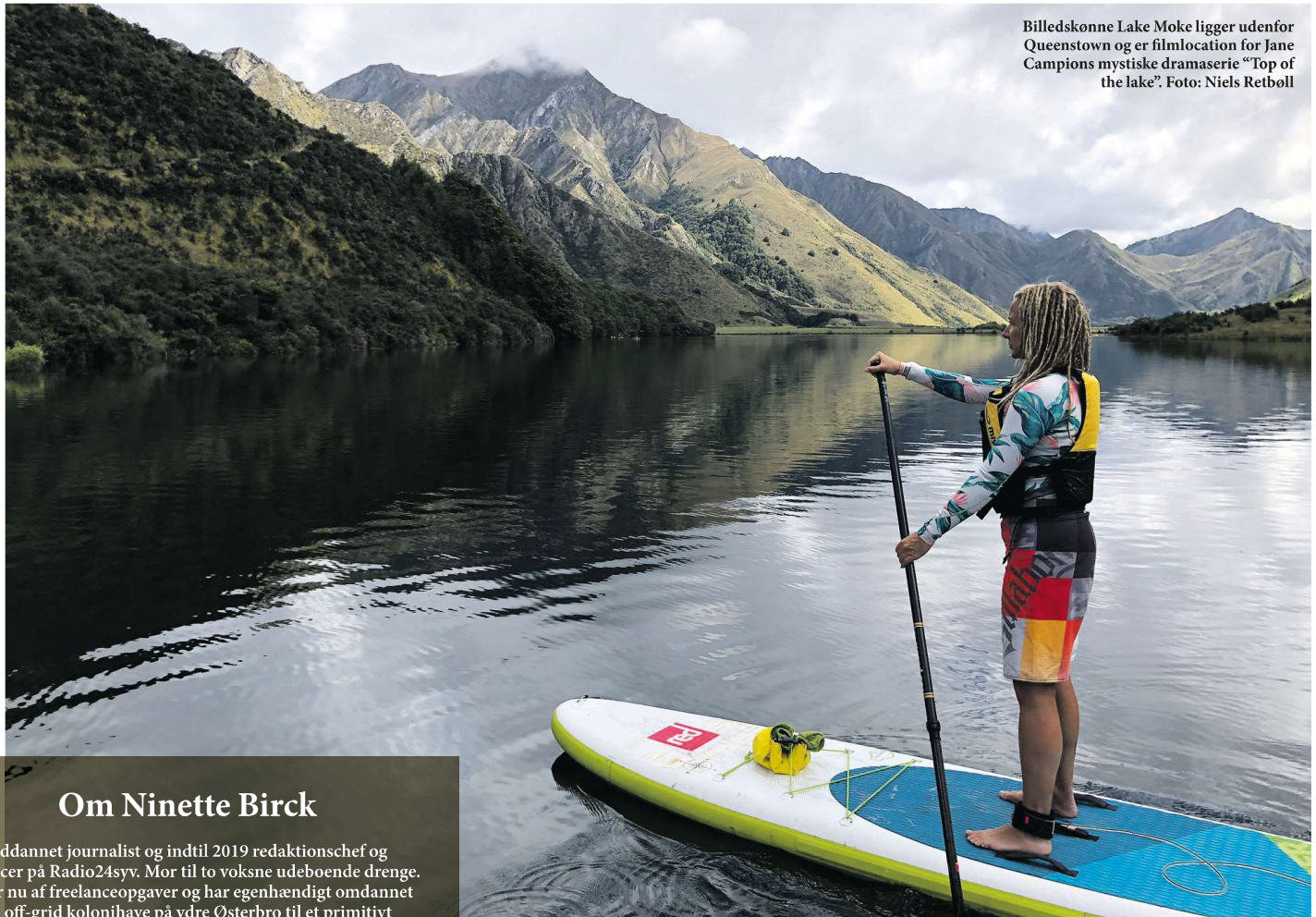
Billedskønne Lake Moke ligger udenfor Queenstown og er filmlocation for Jane Campions mystiske dramaserie "Top of the lake".