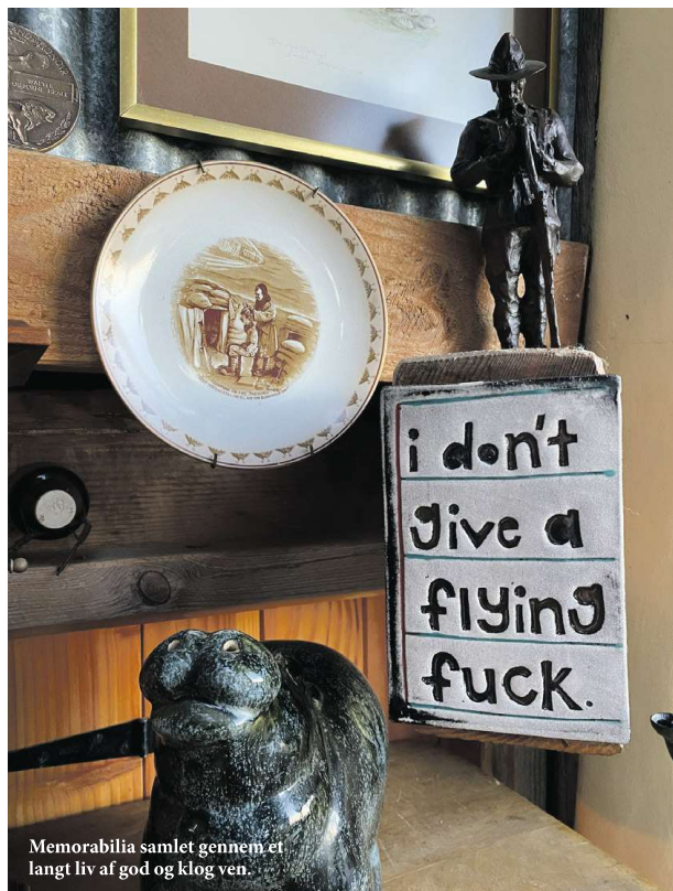
Memorabilia samlet gennem et langt liv af god og klog ven.

AF NINETTE BIRCK - FRI@BERLINGSKEMEDIA.DK