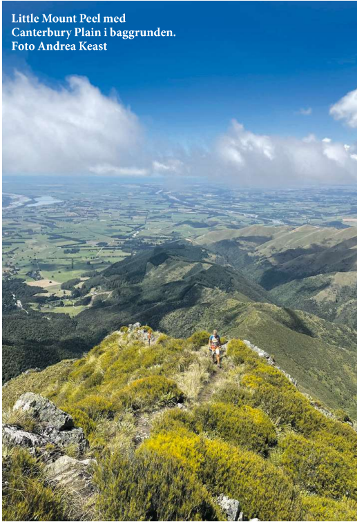
Little Mount Peel med Canterbury Plain i baggrunden.