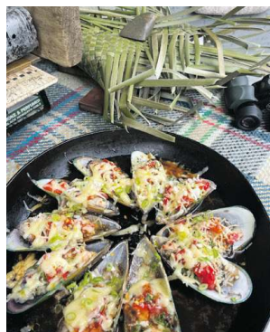
lokalt høstede muslinger tilberedt "māori style", Great Barrier Island.

Planer var afhængige af vind og vejr, og hvis det var godt, smed man, hvad man havde i hænderne, og tog til stranden eller spiste udendørs i delyse netter. Man hjalp til, når man kunne, og blev nogle gange tvunget til at slå græs eller muge ud ved hønsene. Jeg sov i telt med min veninde i baghaven, og vi pakgede madpakker og vandrestoffer eller cyklede ud i landskabet.