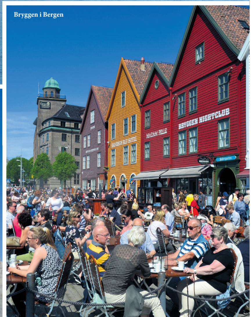
Bryggen i Bergen

Gå også en tur på Bryggen med de farverige pakhuse fra Hansa-tiden, og søg mod Fisketorget, hvor der falbydes alt fra krabber og hvalkød til levende torsk og hummere. Vis-a-vis med torvet ligger Mathallen, hvor du kan få en dejlig frokost med alt godt fra havet i restauranterne Fish Me og Fjellskål.