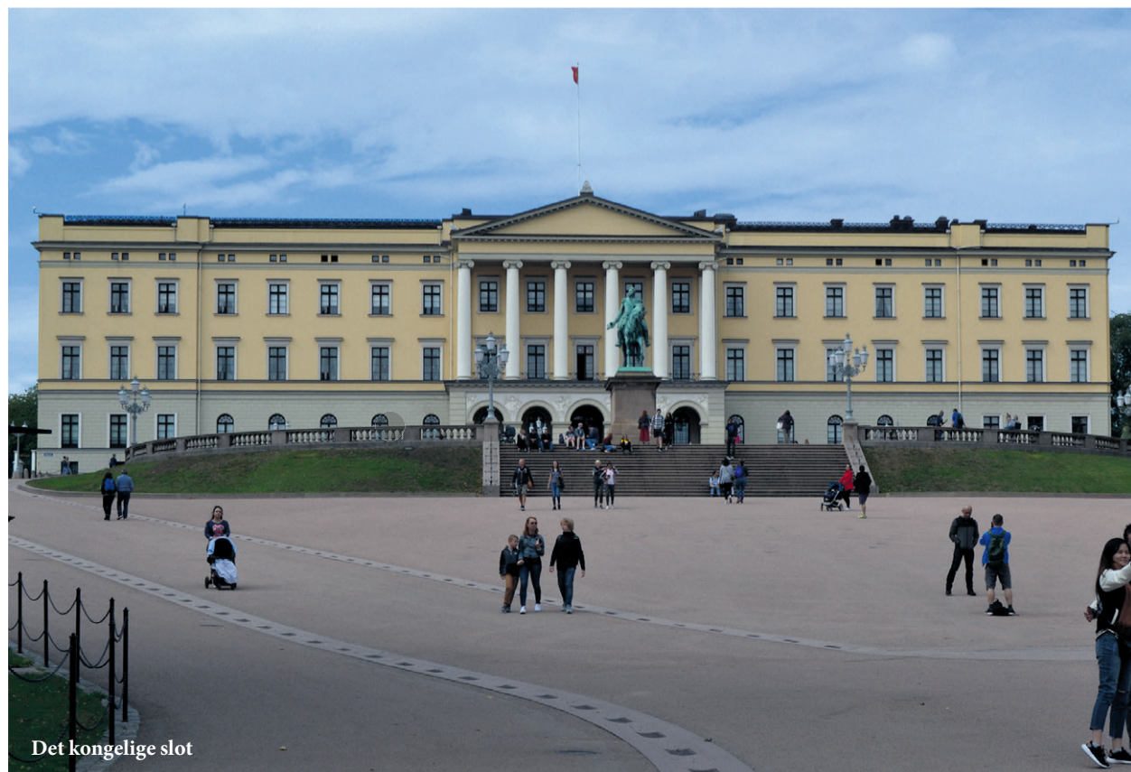
Det kongelige slot

Har du mulighed for det, så skal du sejle med Oslobåden fra København (eller Frederikshavn) og lade rundrejsen begynde i roligt tempo. Det er ikke den hurtigste måde at rejse til Norge på. Det er heller ikke den billigste, men det er den smukkeste og mest oplevelsesrige.