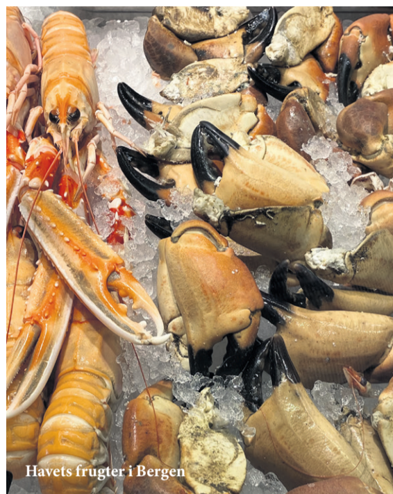
Havets frugter i Bergen