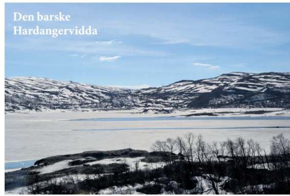
Den barske Hardangervidda