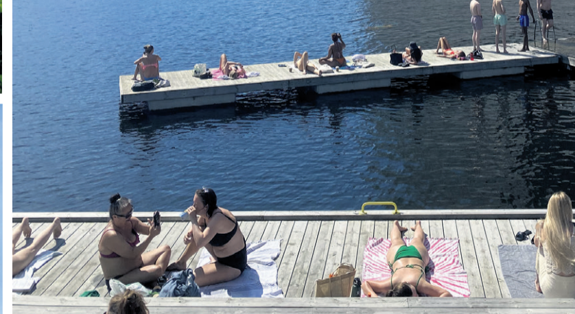
Frokost på Vulkan