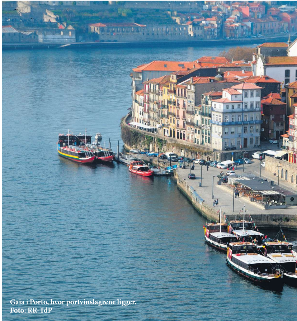
Gaia i Porto, hvor portvinslagrene ligger.