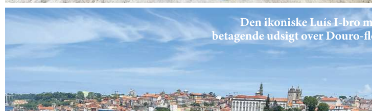
Den ikoniske Luís I-bro med betagende udsigt over Douro-floden