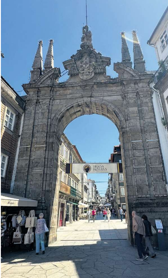
Den smukke byport i Braga – byen, der er Portugals ældste.