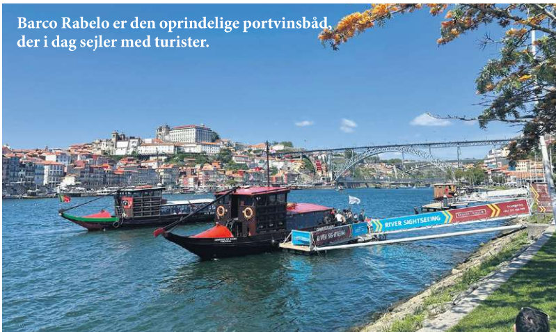
Barco Rabelo er den oprindelige portvinsbåd, der i dag sejler med turister.