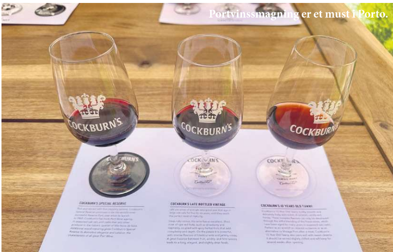
Portvinssmagning er et must i Porto.