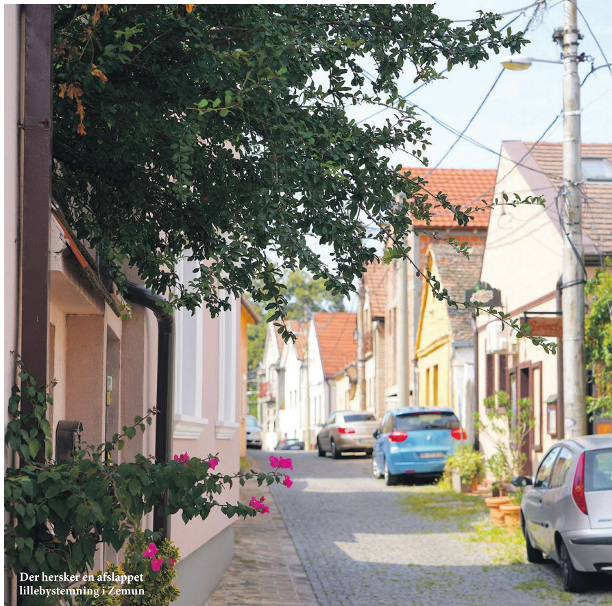
Der hersker en afslappet lillebystemning i Zemun

Bakken var et ideelt sted at bygge et tårn, for når man står deroppe, har man udsyn over både Zemuns røde tage, den vandrige Donau og det omkringliggende landskab. På en klar dag kan man se Beograds højhuse.