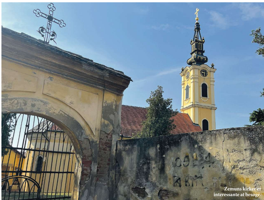
Zemuns kirker er interessante at besøge.